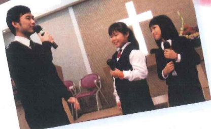
4月14日青年軍主日青年兵分享及募立青年軍幹事。