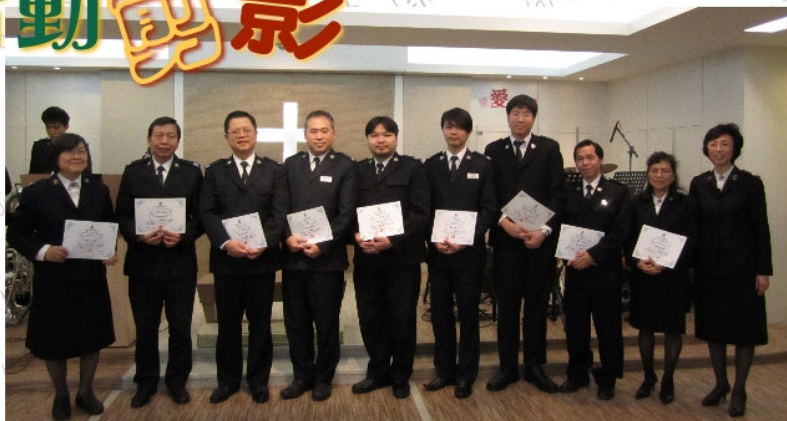
部隊於1月6日覆立幹事。