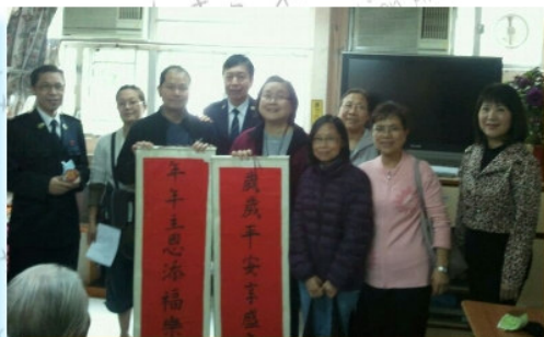
社區關懷組於2月17日探訪南山長者之家。