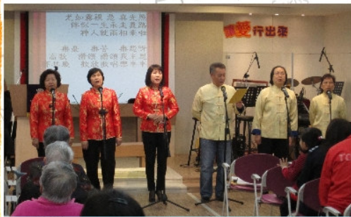
粵曲小組於2月17日新春主日獻唱賀年福音粵曲。