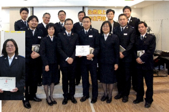
1月9日募立的隊務會議成員