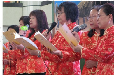
平安夜九龍城廣場報佳音