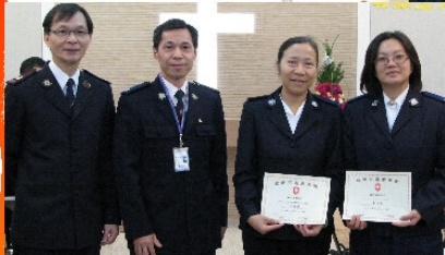
募立社區關懷新成員