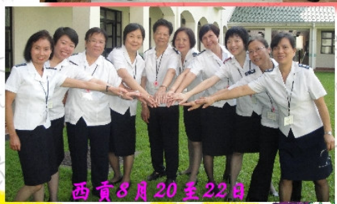
西貢8月20至22日 婦女事工營