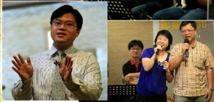
LOVE & LIFE 佈道會 音樂