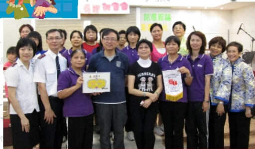
7月14日福音粵曲之頌讚新生命