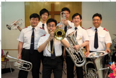
軍區聯合樂隊於6月8日下午蒞臨本隊舉行午間音樂會。