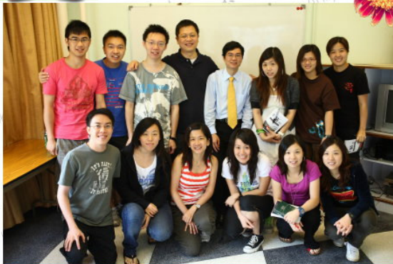
青年團契於5月10日至12日舉行讀經營「睇“帖”營」。