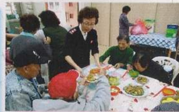
金禧團契於3月11日舉行春茗。