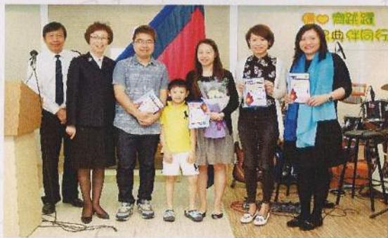
部隊於4月5日復活節主日接納四位副兵。