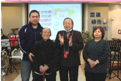
11月29日戶外聚餐(大堂嘉旋山莊)