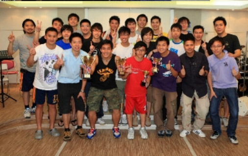
5月31日體育事工頌讚盃籃球賽頒獎禮