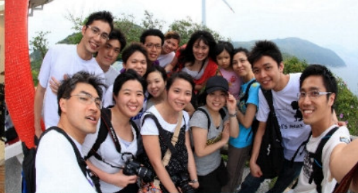
青年團契6月7日南丫島行